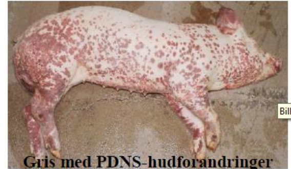
Gris med PDNS-hudforandringer

Den kan give symptomer, der minder om PDNS. Det vil sige abort hos søer samt forandringer i hud, nyrer, lunger og lymfer, der minder om dem man ser ved PDNS.